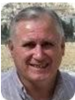
von Al Gist