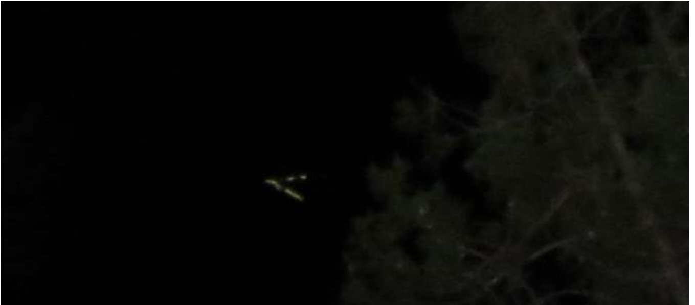
Dreieckige UFO, aufgenommen über dem Secret Canyon